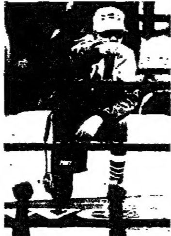
لطفة من مباراة البرازيل والاتحاد السوفياتي لكرة السلة